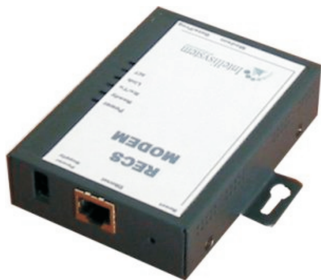
RECS Modem vista frontale